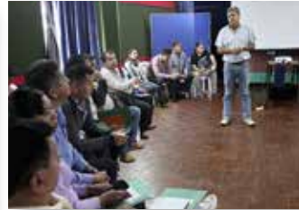
SANTA CRUZ - BOLIVIA 2020