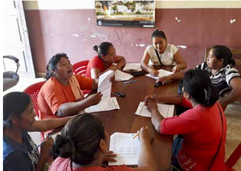
Reunión para conocer las inquietudes de la población indígena del municipio

La participación directa de los actores locales del territorio es fundamental para llevar adelante acciones que involucren para un trabajo conjunto y colaborativo, por ello la importancia de generar alianzas estratégicas en Urubichá han permitido lograr las metas propuestas en el convenio.