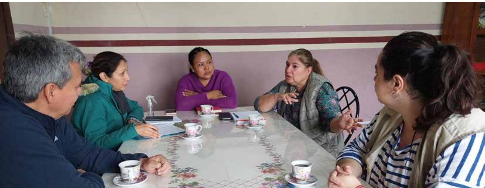
Reunión equipo técnico de IRFA con el gobierno autónomo municipal de Urubichá